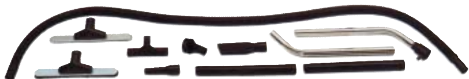
ACCESSORI diam. 40

Dotazione accessori: Cod. 01-318. Dimensioni: 50x36x57 h cm. Capacità: 16 lt. polvere. Alimentazione: 230 V/50 Hz Potenza: 1000 w. Int.tà rumore: 67 dB Cavo: 10 mt. Peso: 9,5 kg.