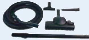
Accessori in dotazione

Dimensioni: 38 x 29 h cm. Capacità: 12 lt. polvere Alimentazione: 230 V Potenza: 1200 w. Int.à rumore: 60 dB Cavo: 8 mt. Peso: 4,6 kg.