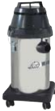
929 RE Cod. 00-1515

Dotazione accessori: Cod. 01-319 Dimensioni: 34x34x57 h cm. Capacità: 14 lt. polvere - 14 lt. liquidi. Alimentazione: 230 V/50 Hz Potenza: 1000 w. Int.tà rumore: 74 dB Cavo: 10 mt. Peso: 8.5 kg.