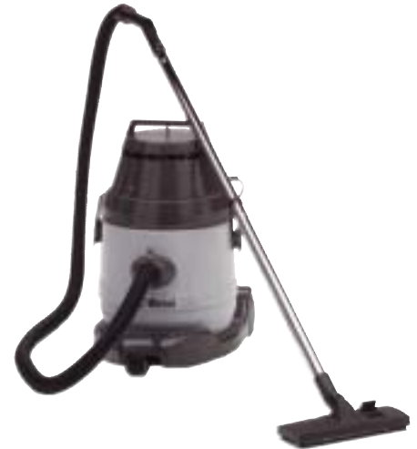
815 Cod. 00-080

Dotazione accessori: 00-210 Dimensioni: 56x57x88 h cm. Capacità: 40 lt. polvere 34 lt. liquidi. Alimentazione: Aria compressa 7 bar Consumo aria: 0,6 mc/min. Depressione: 2800 mm. Int.tà rumore: 72 dB Peso: 22 kg.