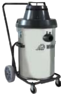
AIRVAC 45 Cod. 00-176

Dotazione accessori: Cod. 00-210. Accessorio fisso frontale è opzionale (cod. 00-200). Dimensioni: 55x68x93 h cm. Capacità: 54 lt. polvere 46 lt. liquidi. Alimentazione: 230 V/50 Hz Potenza: 1500 w. Int.tà rumore: 72 dB Cavo: 10 mt. Peso: 28 kg.