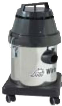
814 INOX Cod. 00-132