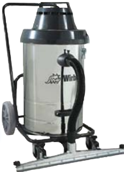
962 Cod. 00-149

Dotazione accessori: Cod. 01-407 Dimensioni: 47x47x86 h cm. Capacità: 40 lt. polvere Alimentazione: 230 V/50 Hz Potenza: 1300 w. Int.tà rumore: 72 dB Cavo: 10 mt. Peso: 22 kg.