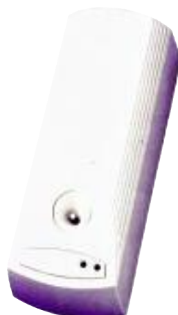
BASIC Cod. 400