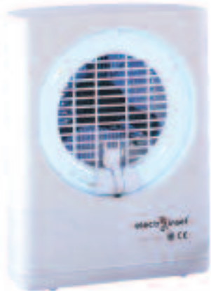
EL 8000 Cod. 039